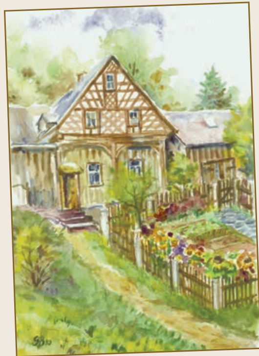
Mundartliches aus dem Vogtland Sieglinde Röhn

Der Gebrauch der vogtländischen Mundart wird immer seltener. Im ländlichen Raum kommen mundartliche Wörter vor allem bei älteren Leuten im täglichen Sprachgebrauch noch vor. Da immer mehr Menschen in anderen Regionen Arbeit finden, wird der vogtländische Dialekt nach und nach verdrängt. Deshalb hat Frau Sieglinde Röhn mundartliche Wörter und Ausdrücke aus dem Kernvogtländischen gesammelt und aufgeschrieben.