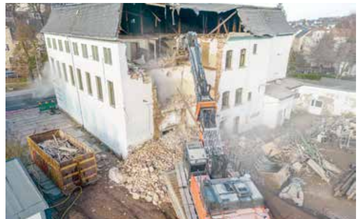
Aufnahme vom 23.11.2022 Blick von oben

Am 22.11.2022 begann der Abriss am hinteren Teil des Gebäudes. Die Arbeiten wurden von der Firma DOTZAUER Lengenfelder Recycling und Abbruch GmbH durchgeführt.