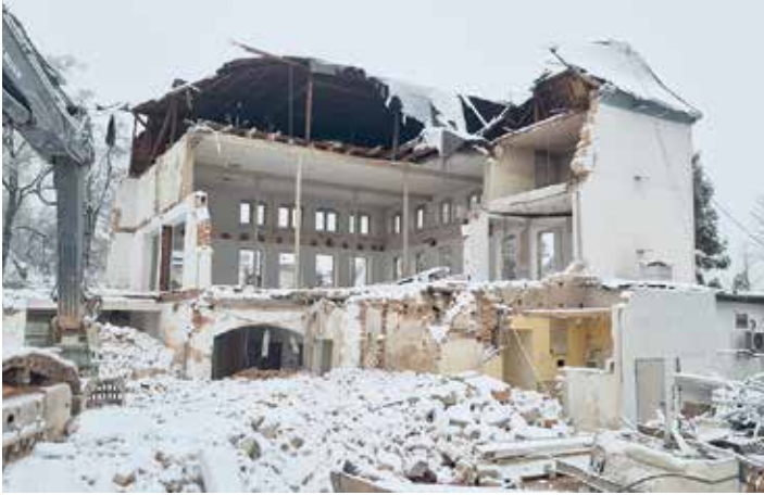
Aufnahme 04.12.2022 Abriss des Gebäudes H34

Die Bauleistungen für den Rohbau sollen im Januar 2023 ausgeschrieben werden.