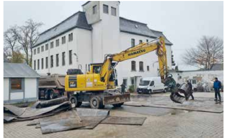
18.11.2022 Der Bagger breitet Matten rund um das Gebäude aus.

Nachdem die Entkernungsarbeiten abgeschlossen waren, erfolgten die Vorbereitungen für die Abrissarbeiten. Dafür wurden im Hinterhof der Hauptstraße 34 in Ellefeld (kurz: H34) Matten ausgelegt. Eine solche Matte wiegt 500 kg. Darauf wurde dann noch Recyclingmaterial aufgetragen. All das waren Schutzmaßnahmen für die Abrissarbeiten.