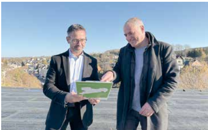
Im Bild Wahlkreisabgeordneter Sören Voigt (links i.B.) und Bürgermeister Jörg Kerber (rechts i.B.) auf dem Dach des entkernten Gebäudes an der Hauptstraße 34.

Der multifunktionale Bürgersaal soll, über die Ortsgrenzen hinaus, eine Bereicherung für das gesellschaftliche Leben werden. Mit dem Fördermittelbescheid ist ein weiterer wichtiger Baustein zur Entstehung des Saals gesetzt.