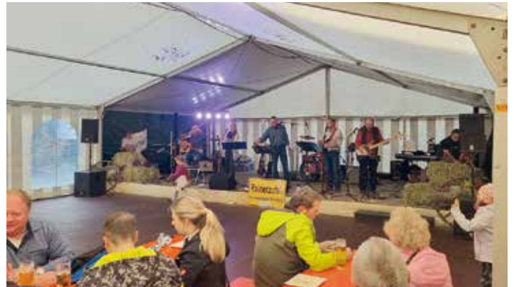
Am Sonntag-Nachmittag sorgte die Band RAINERZUFALL für die musikalische Unterhaltung im Festzelt.