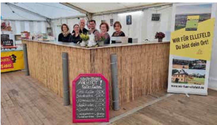
Für Kaffee und Kuchen hat der Verein WIR FÜR ELLEFELD e.V. gesorgt.