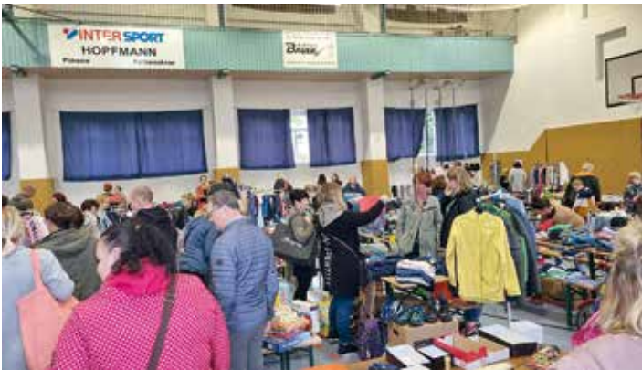
Am Samstag fand der Ellefelder Kinderflohmarkt in der Turnhalle statt. Er wurde ehrenamtlich organisiert und sehr gut angenommen. Herzlichen Dank.