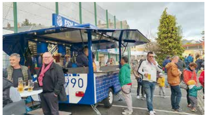
Auch vor dem Festzelt sorgte der Fussballverein alle Kirmestage für frisch Gezapftes und alkoholfreie Getränke.