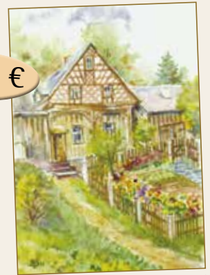
Mundartliches aus dem Vogtland Sieglinde Röhn

erhältlich bei: ALPHA Buchhandlung Buch und Kunst Neumarkt 12, 08209 Auerbach/V., Tel.: 03744 / 21 23 66, E-Mail: auerbach@alpha-buch.de