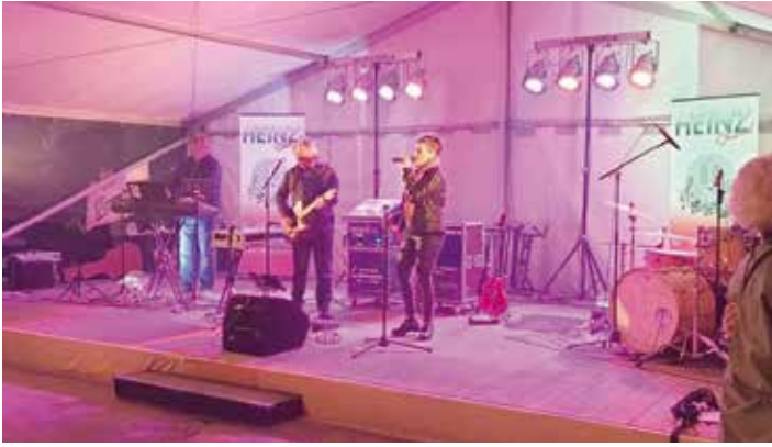
Danach spielte die HEINZ-Band auf.