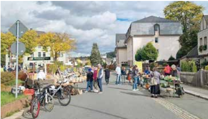
Am Sonntag beteiligten sich einige Bürger und Bürgerinnen am 1. Ellefelder Bürgerflohmarkt. Herzlichen Dank dafür. Es wird eine Fortsetzung geplant.