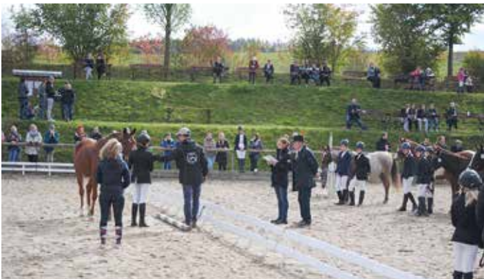
Der Reit- und Fahrverein organisierte am Kirmessonntag ein Breiten-sportturnier. Herzlichen Dank auch hier an alle Beteiligten.