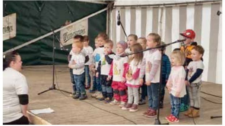
Am Samstag haben die Kinder der Kinderwelt Ellefeld ihr Programm auf der Festzeltbühne aufgeführt. Das ging ans Herz. Vielen an Dank.