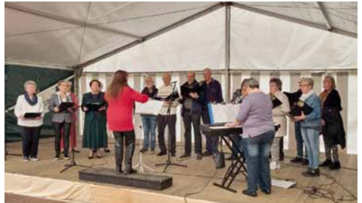
Ebenfalls am Samstag gab der Gemischte Chor ein unterhaltsames Ständchen. Wir danken allen für den musikalischen Beitrag im Festzelt.