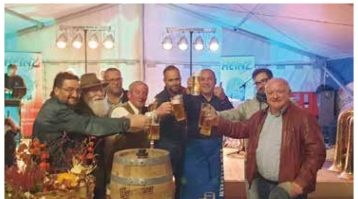
Gemeinsam mit dem Gemeinderat der Gemeinde Ellefeld wurde Freibier verteilt.