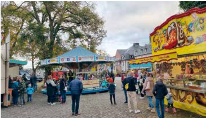
Der Ellefelder Speisewagen und die Schausteller-Familie Hamerschmidt übernahmen auf dem Marktplatz die Kirmesversorgung und Unterhaltung.