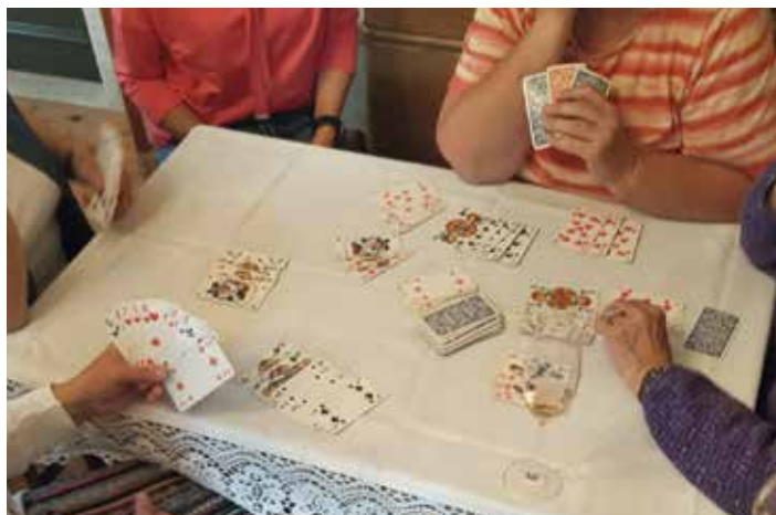
Das Bild entstand beim 1. Rommé-Nachmittag im September.