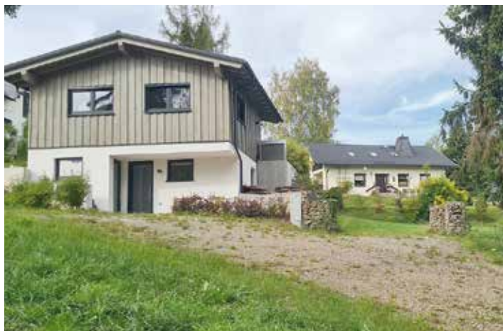
Anblick Winkelgasse 2022

Das ehemals Geyersche und später gemeindeeigene Wohnhaus Winkelgasse 9 war vermietet und wurde im Jahr 2000 abgerissen. Heute steht dort der Neubau eines hübschen Häuschens.