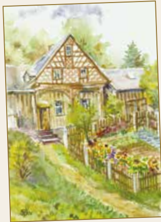
Mundartliches aus dem Vogtland Sieglinde Röhn

Der Gebrauch der vogtländischen Mundart wird immer seltener. Im ländlichen Raum kommen mundartliche Wörter vor allem bei älteren Leuten im täglichen Sprachgebrauch noch vor. Da immer mehr Menschen in anderen Regionen Arbeit finden, wird der vogtländische Dialekt nach und nach verdrängt. Deshalb hat Frau Sieglinde Röhn mundartliche Wörter und Ausdrücke aus dem Kernvogtländischen gesammelt und aufgeschrieben.