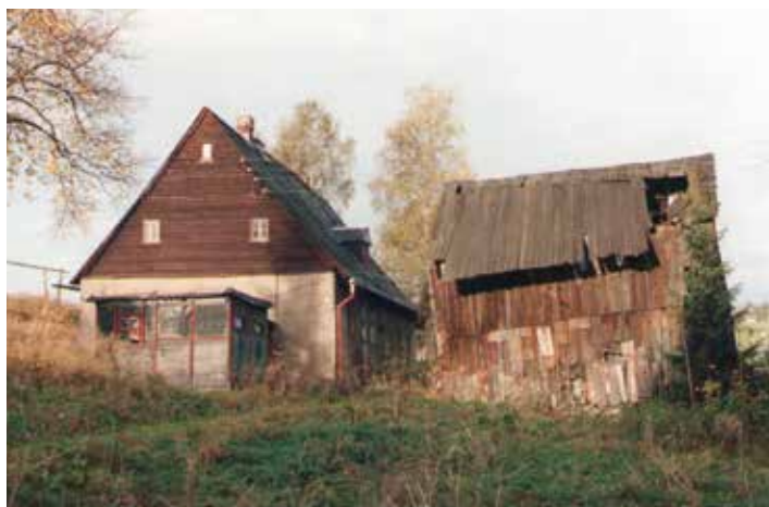
Anblick Winkelgasse 1996