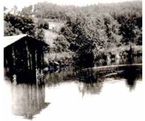
Das Holzhäuschen am unteren Ende des Teiches