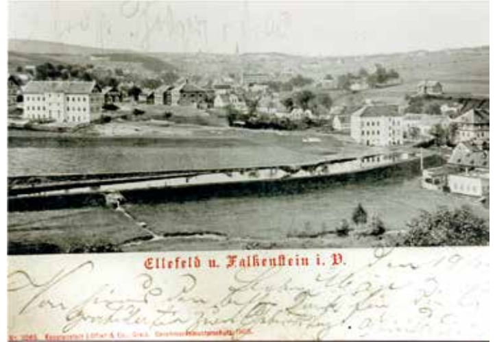
Ansichtskarte Ellefeld, im Vordergrund der Hummels Teich

Eine alte Ansichtskarte von Ellefeld aus der Zeit um die vorige Jahrhundertwende zeigt einen Blick vom Neuberg über die Hohofener Straße hinweg auf unser Dorf. Im Vordergrund ist dabei ein Teich zu sehen, langgestreckt, nur wenige Meter breit, aber wohl an die 100 m lang. Es ist der so genannte „Hummels Teich“.