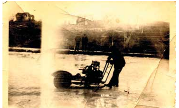
Schneiden von Eis auf dem Teich