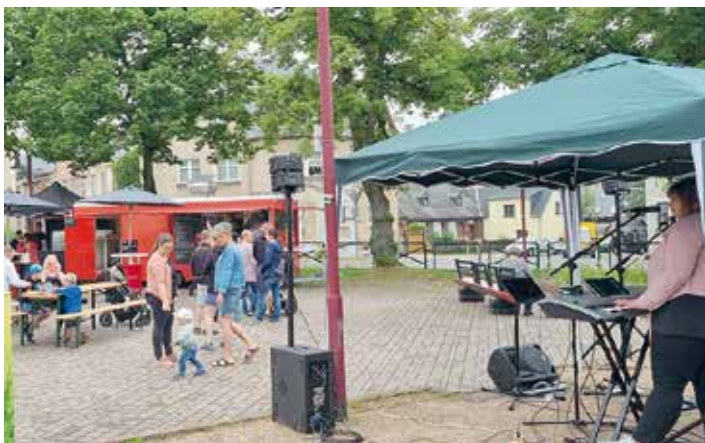
Ein Blick auf den Marktplatz.