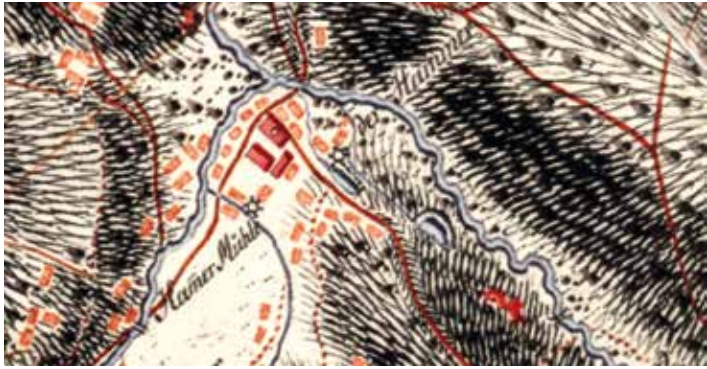
Ausschnitt aus dem Meilenblatt von 1792: Der Hammerbezirk mit beiden Mühlen

karte dargestellte Gewässer. Auf dem Meßtischblatt von 1937 ist die Situation sehr gut zu erkennen.