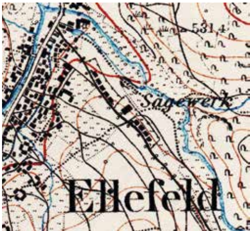
Meßtischblatt von 1898: Ausschnitt Hammerbezirk mit Mühle und kleinem Teich