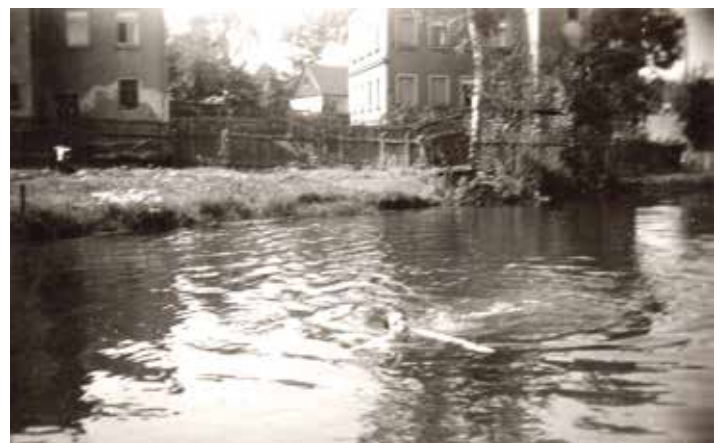
Badefreuden im Hummelsteich

Am 1. Juli 1927 ging über Ellefeld ein gewaltiges Unwetter nieder, Rote und Weiße Göltzsch führten Hochwasser, wobei der Damm von Hummels Teich gefährdet war, jedoch standhielt. Ein weiteres, noch schwereres Hochwasser beider Gewässer gab es am 16. Juli 1927. Die Turbine am Wehr diente in dieser Zeit der Stromerzeugung und auch dem Antrieb in der Wäscherei. Wohl aus Rentabilitätsgründen ist sie in den dreißiger Jahren stillgelegt worden. Das Wasser des Teiches diente weiterhin dem Wäschereibetrieb von Kurt Hummel als Betriebswasser-Reservoir. Die