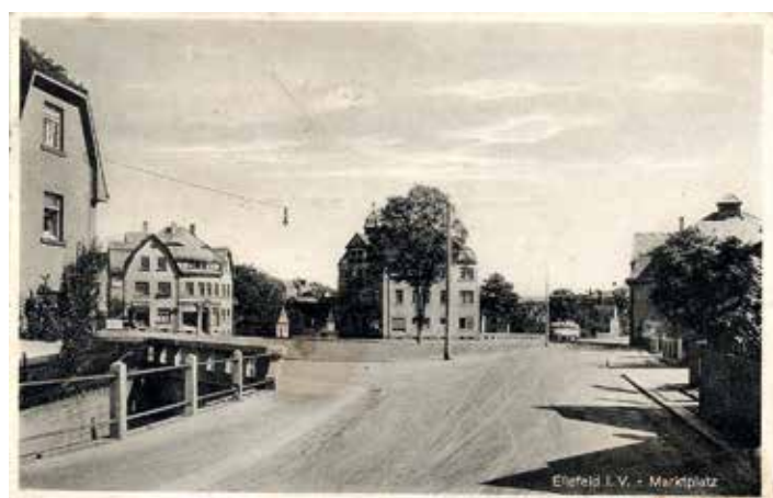
Der Marktplatz mit dem oberen Ende der Überbauung

Im Mai 1925 begannen die Regulierungsarbeiten an der Göltzsch. Im Sommer 1928 werden die drei kleinen Häuschen auf dem künftigen Marktplatz abgerissen. Nachdem schon zuvor die Hammerbrücker Straße ausgebaut worden war, wird nun die Hauptstraße grundhaft erneuert und gepflastert. Der Bau des Marktplatzes ist im Sommer 1929 beendet und im Folgejahr findet hier erstmals ein Wochenmarkt statt. Die gesamte Göltzsch-Regulierung zog sich dann bis 1934 hin.