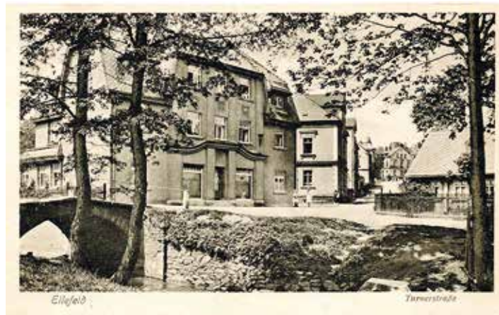
Offenes Göltzschbett mit „Kellners Brücke“

Wie alt die obere Brücke war und ob vor ihr tatsächlich das Gewässer durch eine Furt gequert worden ist, wissen wir nicht. Eine alte Kartendarstellung aus dem Jahre 1840 lässt dies aber vermuten. Und auch das Messtischblatt von 1898 lässt die heutige Turnstraße am Bach enden und am rechten Ufer geht ein Weg zum Forsthaus (= Oberes Schloss) und der Furthweg. Ca. 50 Meter unterhalb befand sich dann eine zweite Brücke, über die die heutige Straße des Friedens führt. Zwischen den beiden Brücken standen drei kleine Häuschen, die von Eckstein, Wied und Seifert.