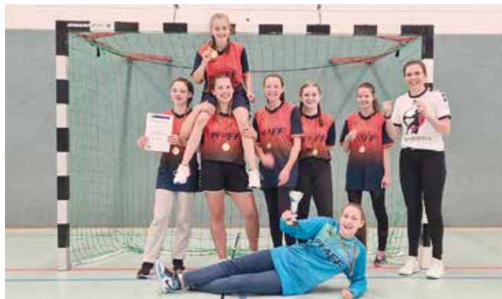
Mannschaften des TV Ellefeld