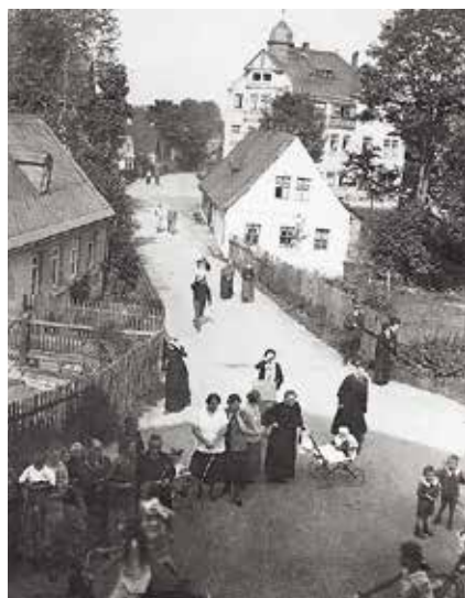
Die drei Häuschen auf dem heutigen Marktplatz, Blick in Richtung Lindenstraße

Der Marktplatz, wie wir ihn heute kennen, stammt aus dem Ende der zwanziger Jahre des vorigen Jahrhunderts. Bis dahin floss die Weiße Göltzsch offen durch das gesamte Dorf, von einigen Straßen- und Fußgängerbrücken überspannt. Die oberste Brücke war eine Bogenbrücke aus Naturstein. Sie stand an der Stelle, wo sich die heutige Hammerbrücker Straße und die Turnstraße treffen, zudem die Furth einmündet und weiter unten dann die Hauptstraße zur Straße des Friedens wird – ein echter „Verkehrsknotenpunkt“ und eigentlich auch prädestiniert für das Zentrum des Dorfes, das sich ansonsten ursprünglich als Straßendorf am Göltzschbett entlangstreckte.