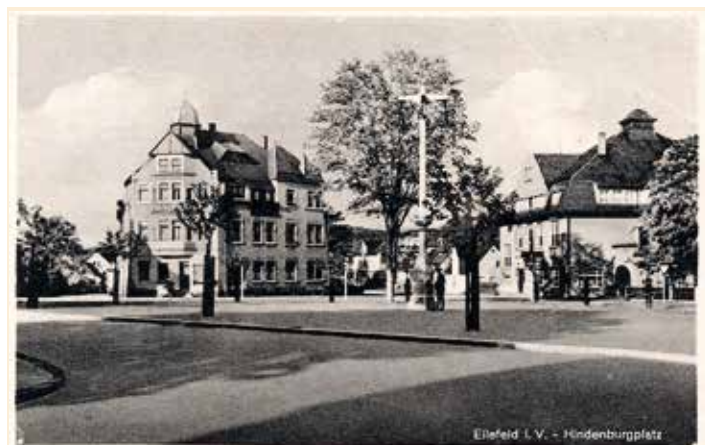
Der Marktplatz in den dreißiger Jahren mit dem zentralen Kandelaber (Ansichtskarten: Sammlung Teichmann)

Im Mai 1925 begannen die Regulierungsarbeiten an der Göltzsch. Im Sommer 1928 werden die drei kleinen Häuschen auf dem künftigen Marktplatz abgerissen. Nachdem schon zuvor die Hammerbrücker Straße ausgebaut worden war, wird nun die Hauptstraße grundhaft erneuert und gepflastert. Der Bau des Marktplatzes ist im Sommer 1929 beendet und im Folgejahr findet hier erstmals ein Wochenmarkt statt. Die gesamte Göltzsch-Regulierung zog sich dann bis 1934 hin.