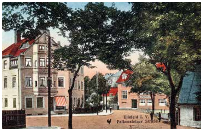
Hauptstraße mit Bäckerei Luderer (links) und Gasthof „Reichsadler“ (rechts), davor das Eckstein'sche Haus

Leider sind uns aus dieser Zeit keine Bau-Unterlagen erhalten. Der Bau des Marktplatzes erfolgte in Zusammenhang mit der Regulierung der Göltzsch. Der Bach wurde insgesamt tiefer gelegt, um einerseits den Durchfluss unter dem Markt zu ermöglichen und um andererseits den Querschnitt des Bachbettes und damit das Fassungsvermögen zu vergrößern.