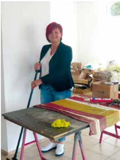
Im Juli gab es noch jede Menge Arbeit zur Einrichtung des Ladengeschäftes

Nach den vielen Jahren in Angestellten-Verhältnissen reifte in ihr nun der Wunsch nach beruflicher Selbstständigkeit. Da kam ihr die Freude an der Herstellung kleiner Köstlichkeiten zugute,