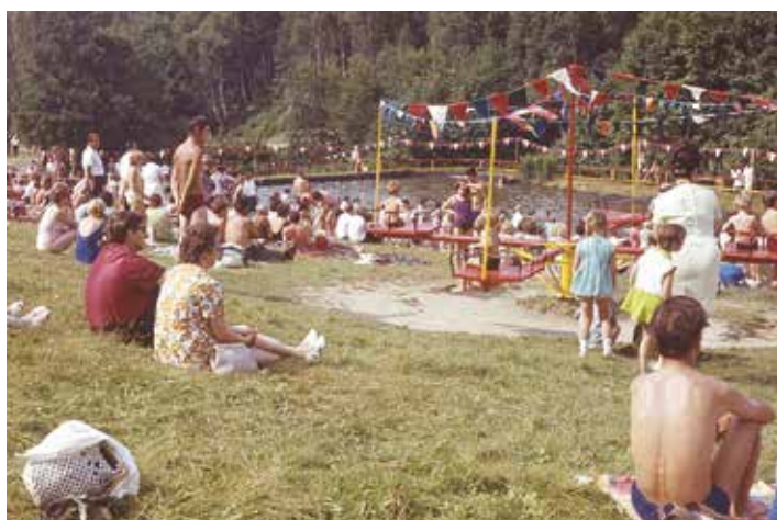
Impression vom Badefest (1972)

Vor 50 Jahren, am 25. Juli 1971, fand das 1. Ellefelder Badefest statt. Für die Vorbereitung und Durchführung waren viele ehrenamtliche Helfer im Einsatz. In der am Hang befindlichen Mehrzweckbude sorgten die Frauen vom DFD für Kaffee und Kuchen sowie Fischsammeln. Unten am Bad waren verschiedene Buden aufgebaut: In der Schießbude, die vom Jagdkollektiv betrieben wurde, gab es für die besten Schützen als Hauptpreis Wildfleisch oder einen Hackstock. Für die Losbude stifteten verschiedene Ellefelder Betriebe Preise. Der Hauptgewinn war ein vom VEB Polstermöbel gefertigter Sessel. Für die Getränkeversorgung war die Familie Bier-Lindner zuständig. Die örtlichen Fleischer boten Bockwurst und Roster an.