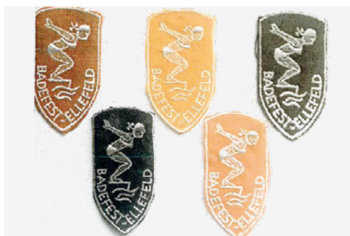
Abzeichen für Ellefelder Badefest

Bis zum Jahr 1992 fanden insgesamt 20 jährliche Badefeste statt. Nur zwei Mal, im Jahr 1986 wegen der Volkswahlen und 1990 zur Wendezeit, ist das Badefest ausgefallen. Die Feste im Ellefelder Bad waren ein Treffpunkt für alle Generationen und bei meist schönem Wetter immer sehr gut besucht. Am 5. Juli 1995 kommt es wegen finanzieller Probleme und ungeklärter Eigentumsverhältnisse zum Badeverbot und zur Sperrung des Waldbades Hohofen. Im Jahr 2009 wurde der Boodtümpfel naturnah gestaltet. Heute erfreuen sich dort viele Spaziergänger und Familien mit Kindern an der schönen Umgebung mit Ruhebänken, Rastplätzen, Spielplatz und dem nahegelegenen Wildgehege.