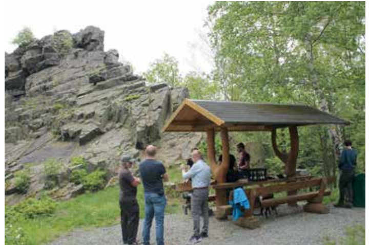
Das Team vor dem Lochstein in Falkenstein

Auch der Lochstein wurde von dem versierten Team vermessen. Auch hier ergeben sich viele moderne und interessante Nutzungsmöglichkeiten dieser erhobenen Daten für unseren Park.