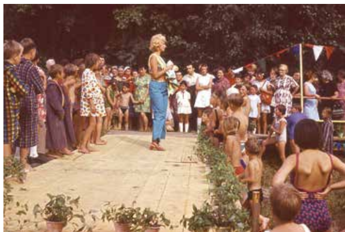
Modenschau vom Badefest (1972)

Programmpunkte waren: Modenschau, Wasserspringen mit alten Kostümen, Auftritt der Jagdhornbläser, Mundartsprecher, Preisschießen und Tanz mit dem "Wema-Ensemble". Die Jugendlichen von Hohofen sorgten für die musikalische Unterhaltung über Tonband und Lautsprecher. Die Beschaffung der benötigten Technik war zu DDR-Zeiten mit Schwierigkeiten verbunden. Für den Eintrittspreis von 1,00 Mark erhielt man ein vom VEB Kolorit gesticktes Festabzeichen.