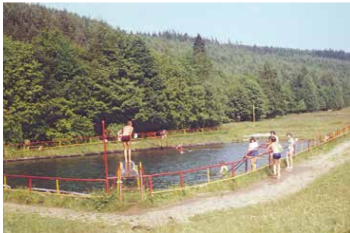
Ellefelder Bad (1972)

Das Waldbad Hohofen, von den Ellefeldern immer noch "Boodtümpfel" genannt, war ein beliebter Treffpunkt für Jung und Alt. Die Schulkinder verbrachten den größten Teil ihrer Sommerferien dort und erlernten das Schwimmen. Für die Teilnehmer der Ferienspiele der Ellefelder Schule war das Bad ein beliebtes Ausflugsziel. Die Kinder pflückten sich mittags am nahegelegenen Waldhang Schwarzebeeren und verspeisten sie im Bad. Abends nach der Arbeit ist man schnell mit dem Fahrrad zum Boodtümpfel gefahren und hat sich erfrischt.