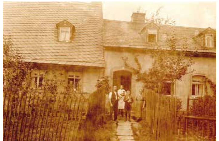
Fotokarte vom Hauseingang (Jahr unbekannt)

Unser Haus hatte noch eine Besonderheit: Im Inneren die beschriebene Gliederung, von außen sah es aber aus, als ob zwei Häuschen zusammengesetzt worden waren. Näheres ist hierüber nicht bekannt.