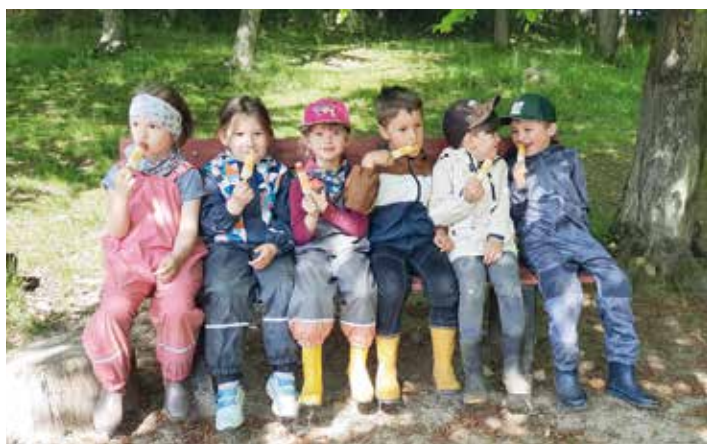
Die Kindergartenkinder beim Eisschlecken.