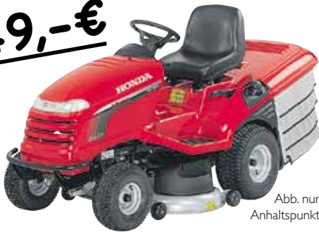
Abb. nur Anhaltspunkt

größte Auswahl Rasentraktoren verschiedener Marken in der Region! 25 verschiedene Aufsitzmäher am Lager.