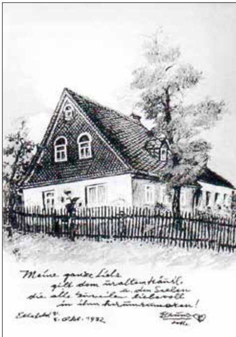
Ansichtskarte mit Zeichnung von Bruno Paul

Die Dachdeckung bestand aus Naturschiefer, verlegt in altdeutscher Deckung. Und auch die Giebelflächen waren verschiefert, häufig um die Fenster herum hübsch verziert. Auch an der Dachkante, dem Ort, war die Verschieferung verziert. Das alles kann man den Federzeichnungen von Bruno Paul entnehmen. Im Nord- und Ostvogtland war es auch üblich, dass an der Giebelseite eine große Schieferplatte eingebaut war, auf der neben dem Monogramm des Eigentümers auch die Jahreszahl der Erbauung zu lesen war, das war aufgemalt oder manchmal auch aus Stanniol ausgeschnitten und aufgelebt. Ob es hier eine solche Tafel gab, wissen wir nicht. Und leider sind