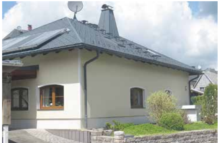
Aktuelle Ansicht Lindenstraße 40