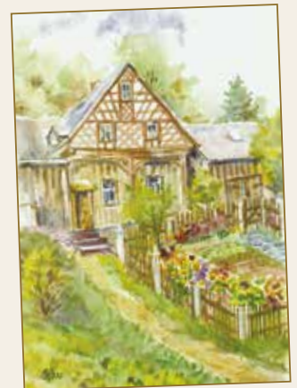
Mundartliches aus dem Vogtland Sieglinde Röhn

Der Gebrauch der vogtländischen Mundart wird immer seltener. Im ländlichen Raum kommen mundartliche Wörter vor allem bei älteren Leuten im täglichen Sprachgebrauch noch vor. Da immer mehr Menschen in anderen Regionen Arbeit finden, wird der vogtländische Dialekt nach und nach verdrängt. Deshalb hat Frau Sieglinde Röhn mundartliche Wörter und Ausdrücke aus dem Kernvogtländischen gesammelt und aufgeschrieben.