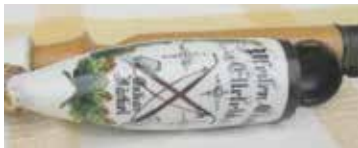
Der Pfeifenkopf

Pfeifen und umrandet mit Eichenlaub. Rückseitig lesen wir den Hersteller Wilhelm Imhoff Cassel und die Umschrift „Jede meiner Pfeifen muss diesen Stempel tragen“.