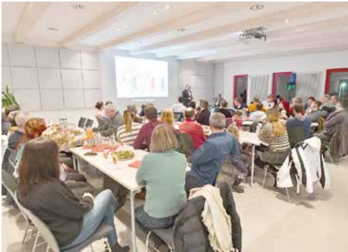
Bei einem kühlen Getränk und Speckfettbrotten konnte man ins Gespräch kommen.

"Herzlich Willkommen in Ellefeld" hieß es am Abend des 05.02.2020 ganz offiziell für alle Zugezogenen des Jahres 2019. Knapp 100 Bürger wurden eingeladen. Knapp 30 sind mit Partner und Kindern der Einladung des Bürgermeisters gefolgt. Das erfreut uns sehr. Es waren an diesem Abend 20 Akteure für Ellefeld im Einsatz und haben den Abend informativ und angenehm gestaltet - Ihnen allen ein herzliches Dankeschön.