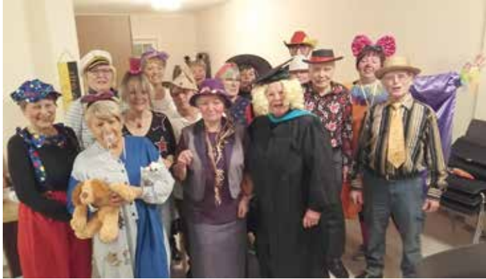
Der Gemischte Chor Ellefeld in Faschingslaune.

Wir würden uns freuen, wenn sich Frauen und Männer aus Ellefeld und Umgebung für den Chorgesang interessieren und jeweils montags in der Zeit von 19.00 Uhr bis 21.00 Uhr zu uns zum „Zuhören“ und Mitsingen in die Turnhalle Ellefeld/Vereinsraum kommen würden. Männer mit Lust und Liebe zum Gesang sind besonders willkommen in unserem Verein!