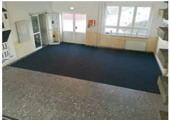
Treppenhaus: Erneuerung des Belages