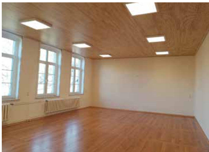
Begegnungszimmer: Erneuerung des Parkettbodens