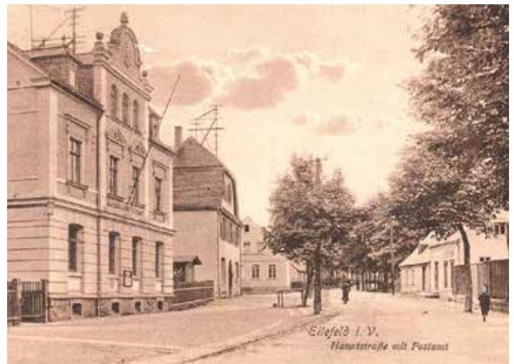
Ansicht aus der Zeit vor dem ersten Weltkrieg

Das als „Kaiserliches Postamt 3. Klasse“ am 1. Juli 1896 eingeweihte Gebäude löste die Postagentur ab, die am 1. Januar 1873 im Gebäude, heute Bahnhofstrasse 3, eröffnet wurde (in der Gasse zwischen Linden- und Bahnhofstrasse). Damit hatte unser Ort einen weiteren wesentlichen Baustein einer Selbständigkeit erhalten, wenngleich auch noch in Abhängigkeit vom Falkensteiner Postamt 2. Klasse. Der Anschluss an den Fernsprecherverkehr erfolgte mit einer Telefonleitung zwischen beiden Postämtern 1882, zunächst also noch zur alten Postagentur. Einen öffentlichen Fernsprecher erhielt das neue Postamt am 1. November 1901, einen Münzfernsprecher am 11. November 1932. Die Leitungen waren seinerzeit oberirdisch verlegt worden, wir sehen auf der alten Ansichtskarte noch die Träger der Leitungen auf den Dächern.