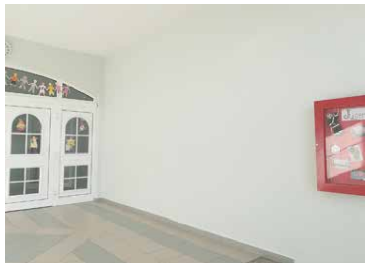
Treppenhaus: Erneuerung des Anstrichs