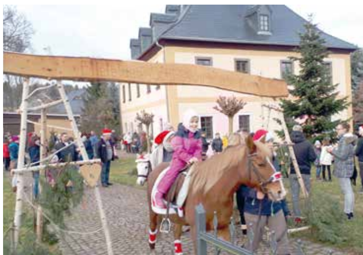
Beim Streichelzoo „Echt Stark“ waren natürlich die Tiere ein großer Anziehungsmagnet für Kinder.