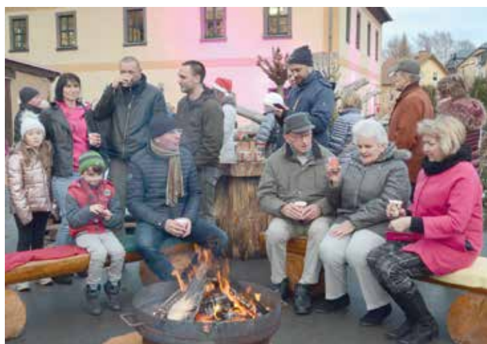
Obwohl der Schnee fehlte, zog urige Gemütlichkeit auf dem Schlossgelände ein.