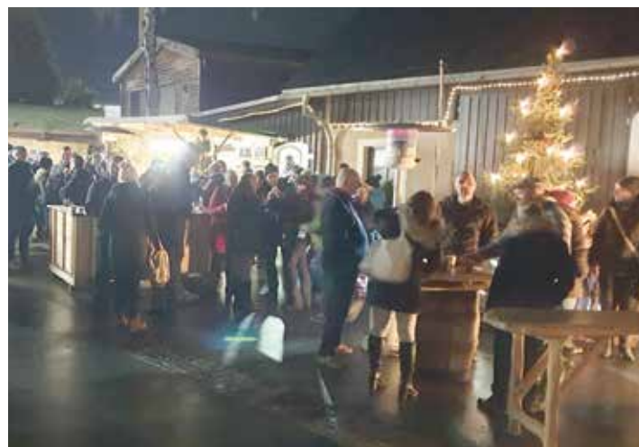
Viele Gäste ließen es sich bei Glühwein, Roster und Knoblauchbaguette gut gehen.