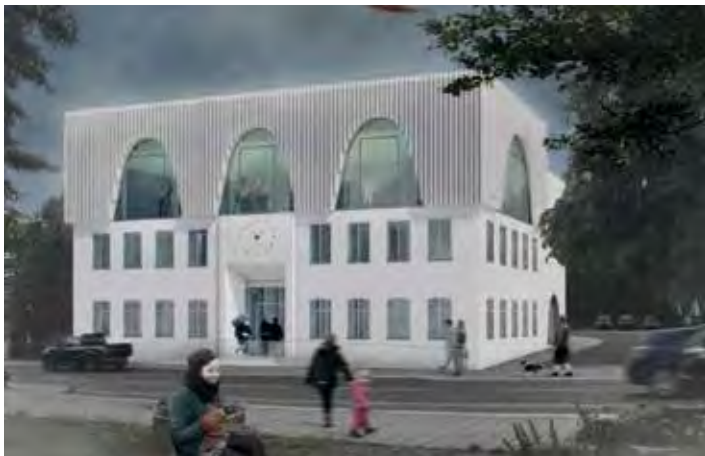
Entwurf der „neuen“ Hauptstraße 34 von dem Architekten Ronny Neumann

Die Planungsleistung für die Objektplanung wurde im Oktober 2019 vom Gemeinderat in einer öffentlichen Sitzung vergeben. Diese war in einem europaweiten Verhandlungsverfahren mit Teilnahmewettbewerb ausgeschrieben. Die Gewinner-Konzeptidee stammt von dem Architekten Ronny Neumann aus Plauen. Die Außenansicht ist im nachfolgenden Bild zu sehen.