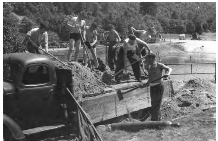
Bauarbeiten in den 50er Jahren