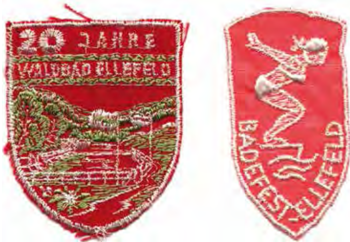
Gestickte Abzeichen zu den Badefesten

Anmerkung der Redaktion: Unser Titelblatt zeigt diesmal das „Ellefelder Bad“ / Feuerlöschteich in den Sommern 1959, 1972 und ganz aktuell 2019.