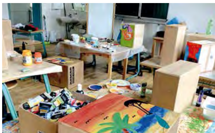
Das Projekt fand im Atelier der Grundschule statt.