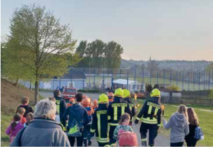
Die Feuerwehr begleitete den Fackelumzug von der Grundschule zum Sportplatz.

Die Feuerwehr Ellefeld, der Fußballsportverein und der Reit- und Fahrverein Ellefeld haben auch in diesem Jahr wieder einen traditionsge- rechten Abend organisiert. Vielen Dank dafür. Zahlreich nahmen die Gäste dieses Angebot an und erfreuten sich an Fackelumzug, Höhen- feuer, Gegrilltem und der Fohlentaufe.