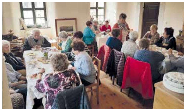
Ein Blick in die gut besuchte Hutzenstube.

Mehr als 50 Gäste, knapp 150 Tassen Kaffee, zehn leckere Kuchen und einige Gläschen Sekt – so kann man kurz unseren Hutzennachmittag vom 30.03.2019 beschreiben. Der Verein WIR FÜR ELLEFELD e.V. freut sich sehr, dass viele Gäste die Einladung zu einem schönen und leckeren Nachmittag angenommen haben. Liebe Gäste, schön, dass ihr da ward. Liebe Mitglieder, danke für euren Einsatz. Der nächste Hutzennachmittag wird im August stattfinden. Dann wird es Leckeres vom Grill geben. Das Schlosscafé kann man das nächste Mal zum Schlossfest am 18.05.2019 besuchen. Wir begrüßen Sie gern.