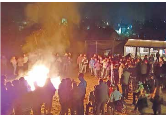
Der Fußballsportverein FSV Ellefeld begrüßte mit einem Höhenfeuer, mit Speisen und Getränken. So konnte man es sich gut gehen lassen.