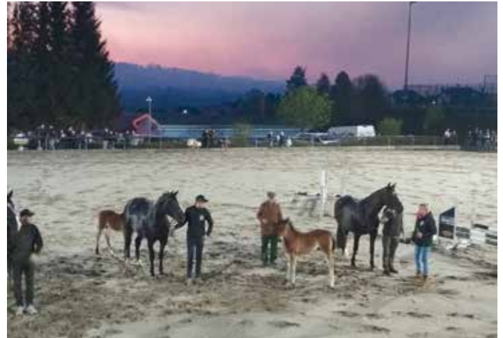
Die Taufe der diesjährigen Fohlen durfte man auf dem Reitplatz beim Reit- und Fahrverein miterleben.