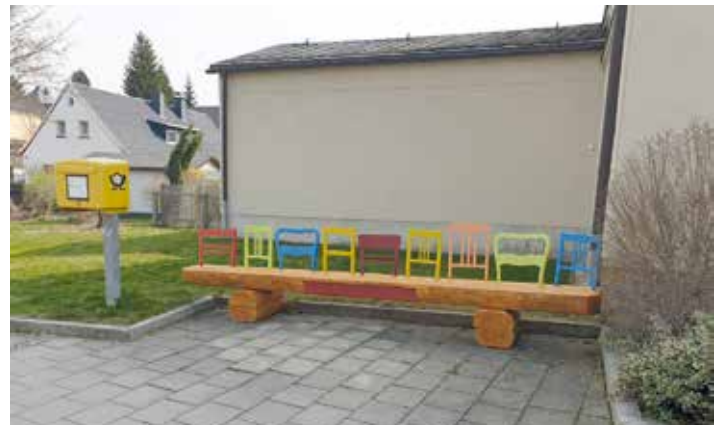
Kunterbunt ist die Bank an der Buchhaltestelle.