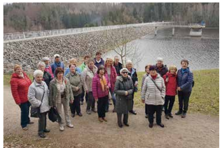
Blick auf die Gruppe an der Talsperre in Falkenstein

Nach langer Winterpause fand endlich am 3. April die erste Ellefelder Seniorenwanderung im Jahr 2019 statt.