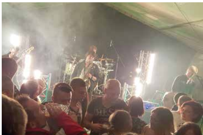
Am Abend des Kirmessamstag rockte SIMULTAN das Festzelt.