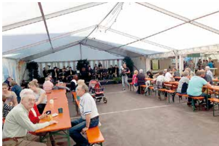
Am Sonntagnachmittag ließ das Jugendblasorchester Auerbach im Festzelt mit einem Kaffeekonzert aufhorchen.