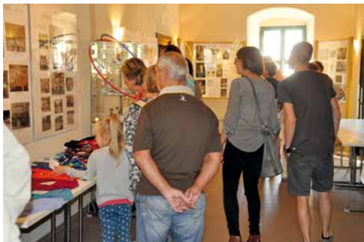
Die Ausstellung der Heimatfreunde hatte den Titel "160 Jahre Turnverein Ellefeld". Unzählige Fotos und allerlei "alte Stücke" wurden dafür zusammengetragen und präsentiert.