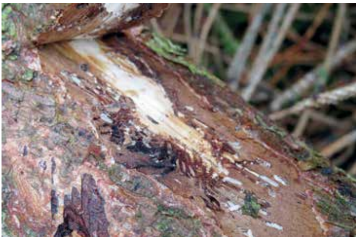
Fraßgänge des Buchdruckers dicht unter der Borke.

Die Bekämpfung ist nur möglich durch das Schlagen befallener Bäume und die sofortige Beräumung. Daher können wir auch jetzt, außerhalb der Holzernte-Zeit, das notwendige Fällen von Waldbäumen beobachten.