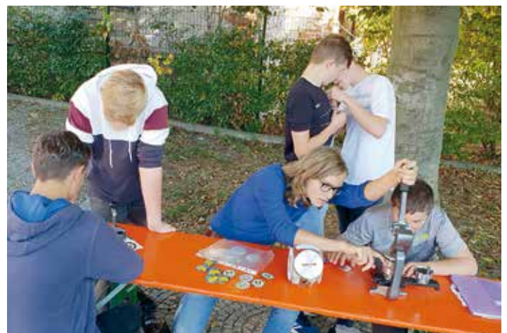
Zum ersten Mal war die Organisation Junges Ellefeld mit auf der Kirmes dabei. Sie werkten Anstecker (auch Button genannt) mit verschiedenen Motiven für die Besucher.