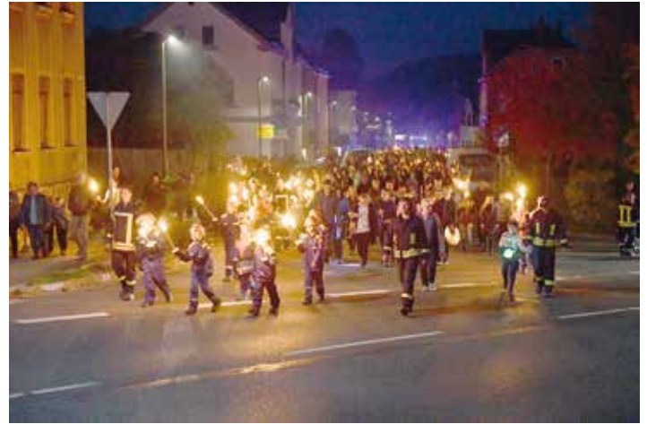
Der Freitagabend begann mit dem traditionellen Fackel- und Lampionumzug von der Kinderwelt zum Festzelt.