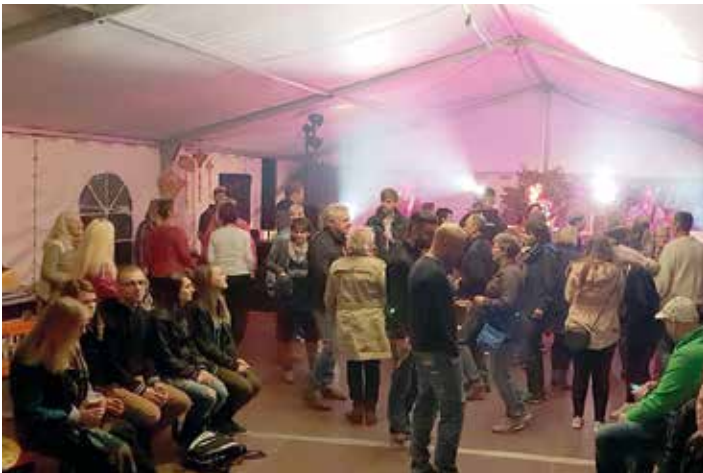
Die Band MRB-LIVE übernahm am Kirmesfreitag die Unterhaltung im Festzelt.