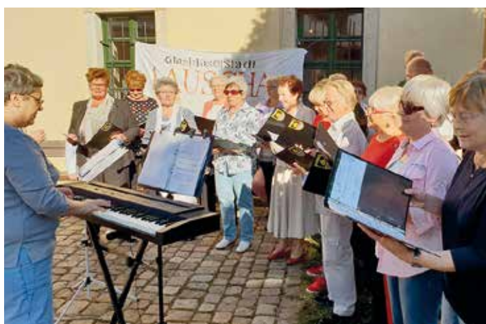
Der Gemischte Chor Ellefeld brachte am sonnigen Sonntagnachmittag musikalische Stimmung vor das Obere Schloss.