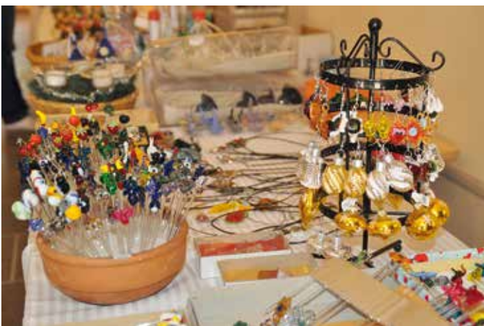
Auch eine Ausstellung hatten die Glasbläser aus Lauscha mitgebracht. Und das waren nicht nur schöne Weihnachtskugeln. Man konnte staunen, was alles aus Glas hergestellt werden kann.