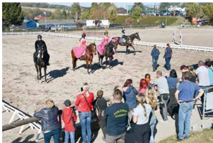
Auf dem Reitplatz herrschte derweil Sportlichkeit hoch zu Ross. Das Breitensportturnier vom Reit- und Fahrverein Ellefeld zog viele Gäste und Sportler an. Bis in die späten Nachmittagstunden war auch hier Interessantes zu sehen.