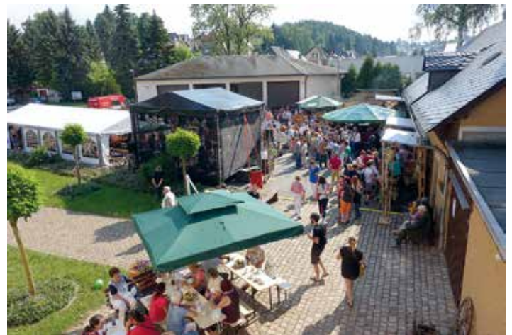
Ein Blick vom Schloss auf das Festgelände. Dieses Jahr zum ersten Mal mit einer großen Bühne.