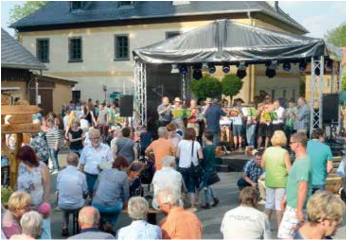
Bei gutem Wetter und toller Unterhaltung auf der Festbühne konnten viele Leute am Oberen Schloss begrüßt werden.