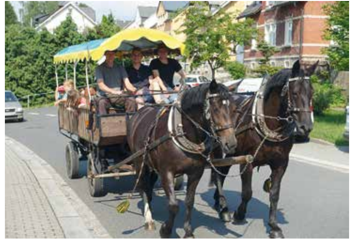
Kutschfahrten mit dem Reit- und Fahrverein.