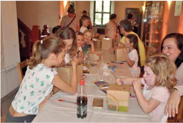
Kartons bemalen – war die Mitmachaktion des 5. Schlossfestes.