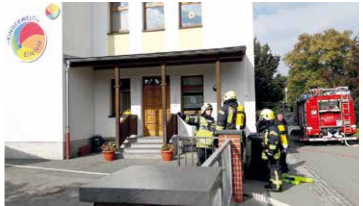
Die Ellefelder Feuerwehr im Probeinsatz