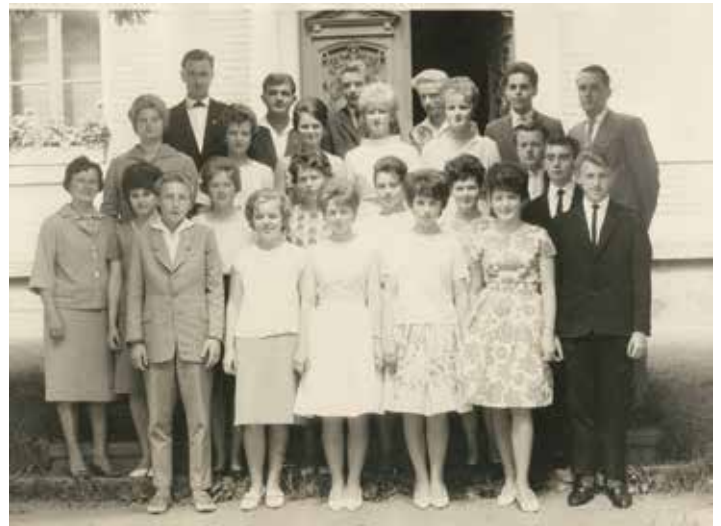
Absolventen der ersten 10. Klasse im Juli 1963

Im April 1961 wurde ein Teil von uns konfirmiert und der größere Teil musste nach viel ideologischer Arbeit und Ausübung von Druck auf unsere Eltern an der Jugendweihe teilnehmen. Nach der Jugendweihe unternahmen wir eine Mehrtagesfahrt nach Weimar. Wir besuchten dabei die Goethe- und Schiller-Gedenkstätten, das Nationaltheater in Weimar und das Konzentrationslager in Buchenwald. Wir alle, Jungen, Mädchen und Lehrer, schliefen in Weimar in einem großen Raum und wuschen uns zur Morgentoilette in einem Holztrug im Freien. Wer an der Jugendweihe teilgenommen hatte, konnte sich ein Jahr später auch konfirmieren lassen.