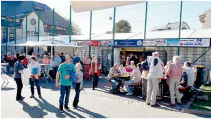
Das Kirmeswetter war hervorragend. Der Festzeltbetrieb konnte deshalb auch draußen im Sonnenschein stattfinden.

Bei Kaffee und Kuchen bei Musik des Jugendblasorchesters Auerbach klang die Ellefelder Kirmes 2017 am Sonntagnachmittag aus.