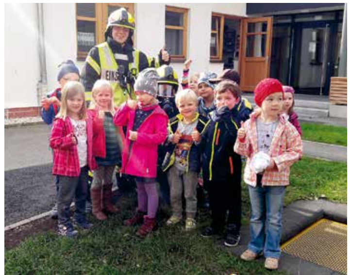
Die Feuerwehr – dein Freund und Helfer. Zum Abschluss gab es noch ein gemeinsames Foto