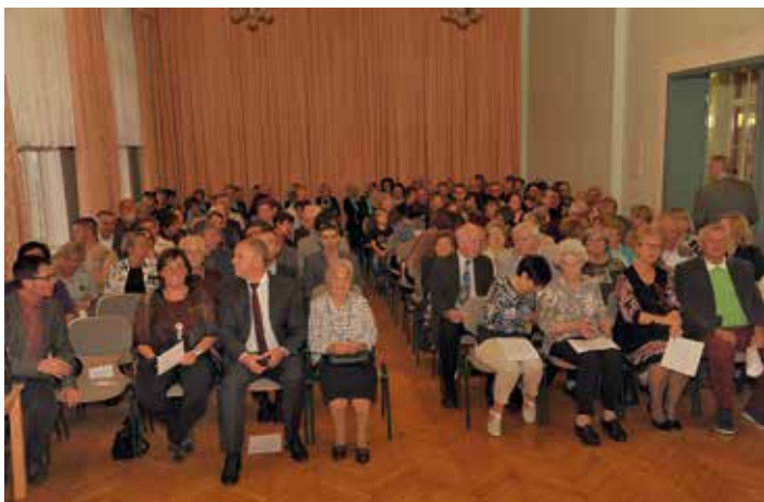
Zahlreiche Gäste erfreuten die Organisatoren an diesem Abend