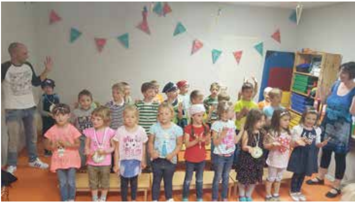
Die Schulanfänger 2017