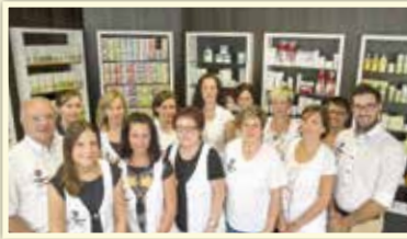
Das Team der Löwenapotheke Ellefeld freut sich auf Ihren Besuch.