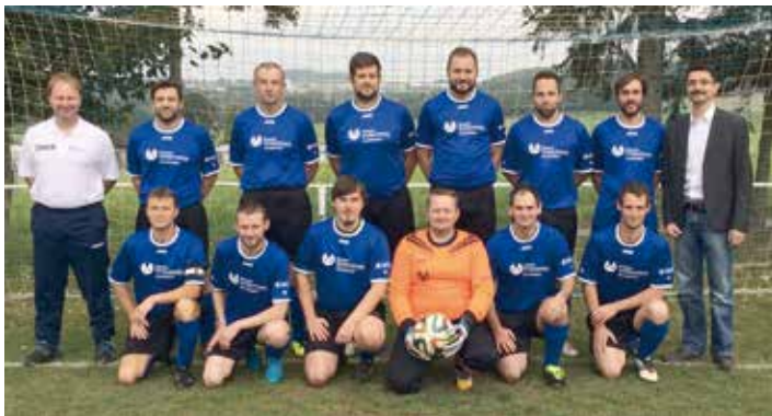
Die Reservemannschaft des FSV Ellefeld