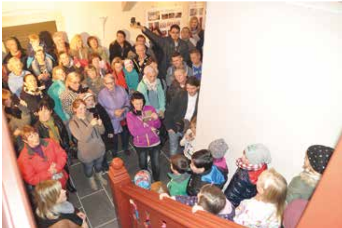
Auftritt der Kinderwelt