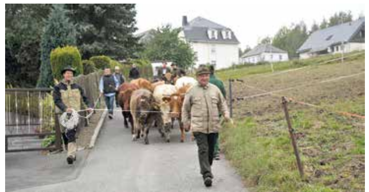
Heimkehr der Ellefelder Kühe