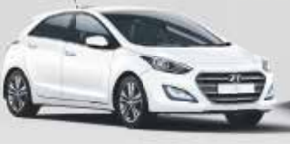
Hyundai i30 Classic 1.4 • 74 kW (101 PS)