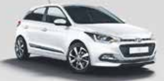
Hyundai i20 Classic 1.2 • 55 kW (75 PS)