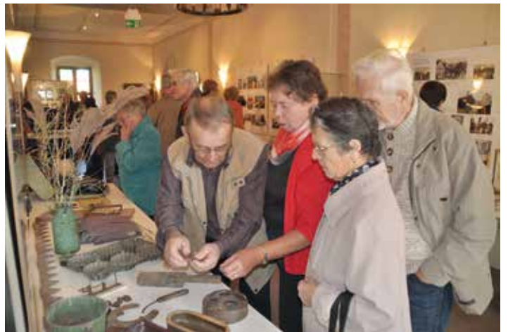
Ausstellung der Heimatfreunde