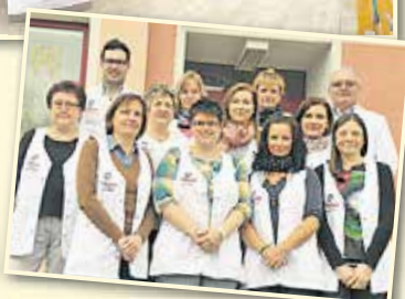
Das Team der Löwenapotheke Ellefeld freut sich auf Ihren Besuch.