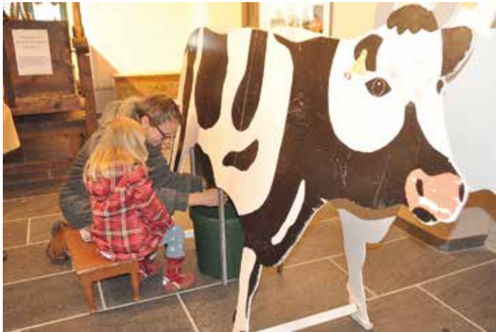
Melkmodell im Schloss