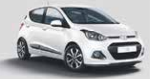
Hyundai i10 Classic 1.0 • 49 kW (67 PS)