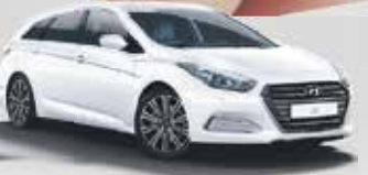
Hyundai i40 Classic 1.6 • 99 kW (135 PS)