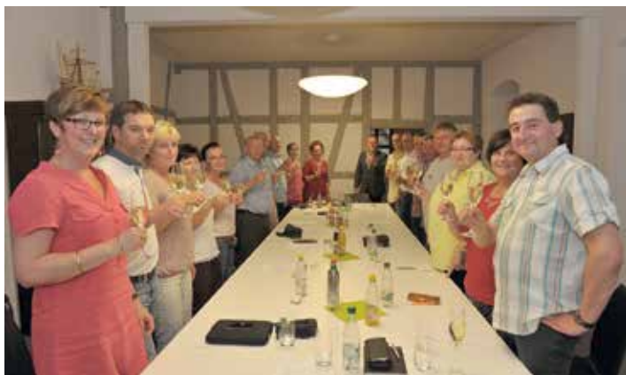
Die Gründungsmitglieder des Vereins

lebenswertes Ellefeld. Da der Verein weiter wachsen soll, würden wir uns über heimatverbundene Bürger freuen, denen diese Ziele auch am Herzen liegen und die Mitglieder im Verein werden möchten. Interessenten können sich gerne postalisch (08236 Ellefeld, Hammerbrücker Straße 4) oder über die Mail-Adresse verein@ellefeld.de an den Verein wenden.