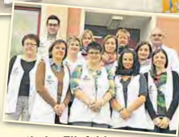
Das Team der Löwenapotheke Ellefeld freut sich auf Ihren Besuch.