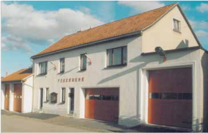
Das Gerätehaus in der Lindenstraße im Jahr 1996