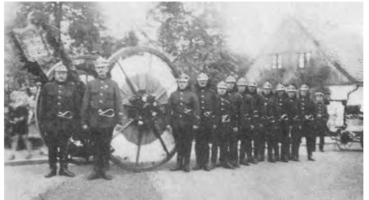
Steigerzug mit Drehleiter um 1920