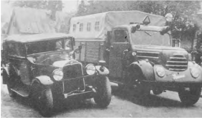
Das alte (Buick, links i.B.) und das neue (Garant, rechts i.B.) Löschfahrzeug 1961