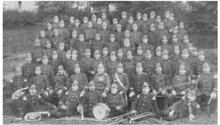
Die Feuerwehr im Jahr 1906