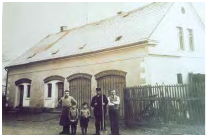
Das Spritzenhaus in der Lindenstraße um 1930

Im Jahre 1926 hatte die Wehr mit insgesamt 86 Mann folgendes Aussehen: