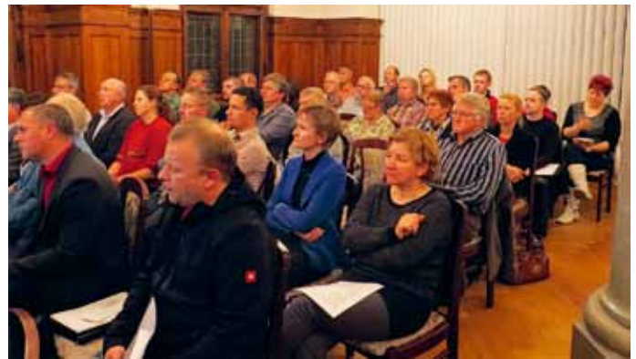
Regionalforum im Rahmen der Erstellung der Lokalen Entwicklungsstrategie für die Region „Falkenstein – Sagenhaftes Vogtland“