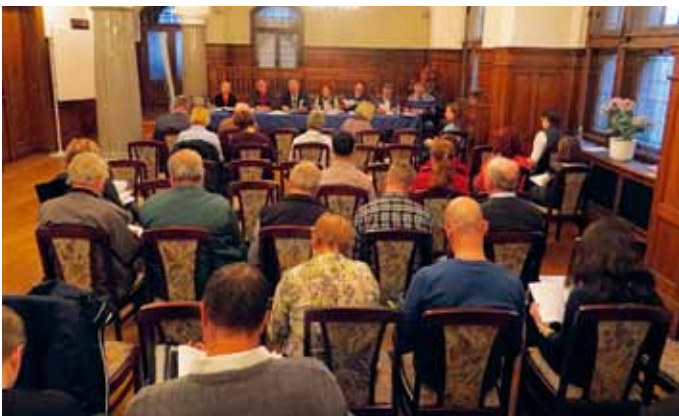
Mitgliederversammlung des Vereins „LEADER-Aktionsgruppe Sagenhaftes Vogtland – Regionalentwicklung, Tourismus und Marketing“ e.V.