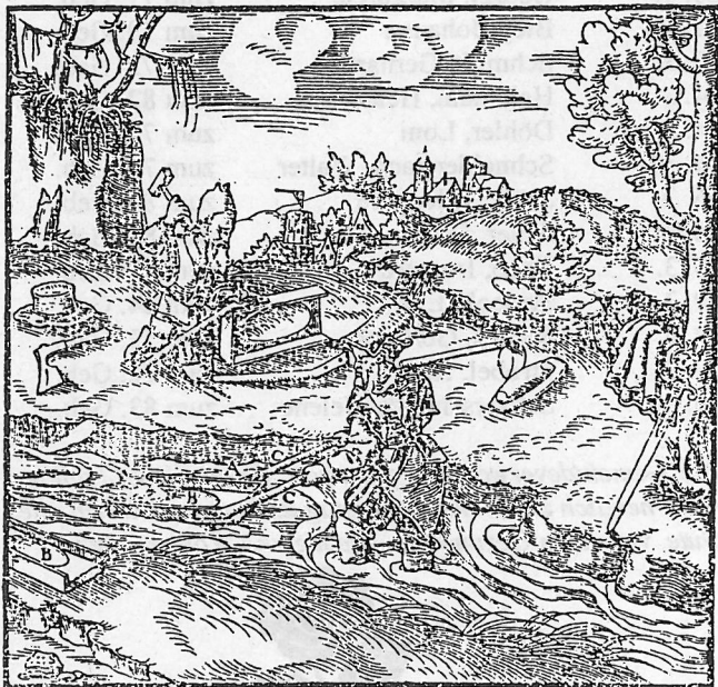
Abb.: Seifen von Erzen in einem Bach (mittelalterliche Abbildung von Georgius Agricola)

Bergmännisch abzubauen Gold gab es freilich im Vogtland nicht, trotz daß sich in den Unterlagen des berühmten Georgius Agricola von ca. 1530 Hinweise auf einen Bergbau auf Gold bei Kottenheide finden, die aber historisch nicht nachweisbar sind. Man stößt auch immer wieder auf Venetianer-Sagen, in denen den "Walen" (schatzsuchende Italiener, die durch die Lande zogen) Kenntnis von Gold-Lagerstätten zugeschrieben wurden, die in Walenbüchern verzeichnet sein sollen. So wird im Dresdener Staatsarchiv ein solches Buch aus dem Jahre 1590 aufbewahrt. Die darin gemachten Angaben sind aber oft so ungenau, daß sie heute kaum exakt lokalisiert werden können. Eine Kostprobe: "Auffm Schneeberg frage nach dem Schloß Wiesenburg, dabey fleust ein Wasser hinweg, an diesem gehe aufwärts fort biß du kommst dem Schafstall gleich, daselbst stehet ein Teich, über diesem Teich suche in dem Wasserlein, so wirst du viel und gute reichhaltige Gold-Körner darinnen finden, welche dir die Mühe wohl belohnen werden." Es bleibt das Geheimnisvolle, das Fremdländische, der Erzsucher und Bergkundigen, die angeblich unermesslichen Reichtum fanden und ihn in venezianischen Palästen anhäuften.